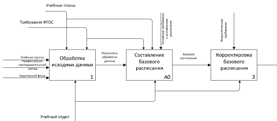
Рис. 2. Диаграмма потоков данных

Общие этапы процесса обработки данных для формирования расписания приведены на рис. 2.