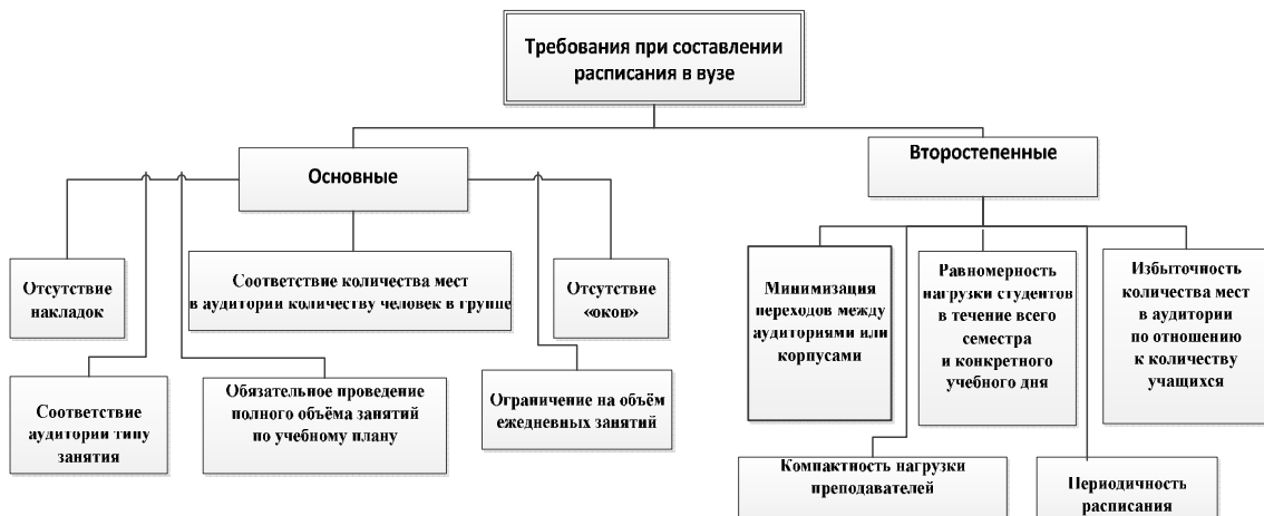
Рис. 1. Классификация требований при составлении расписания

Обобщённая классификация требований к расписанию в вузе приведена на рис. 1.