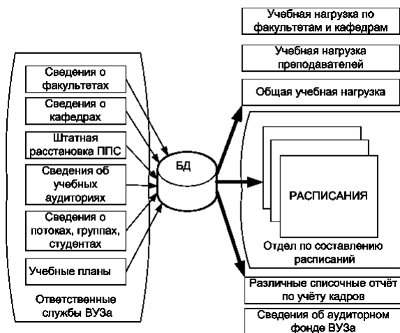
Рис. 2. Поток данных при системном подходе

Таким образом, схема потоков данных примет вид, представленный на рисунке 2.